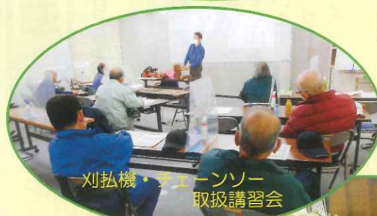
刈払機・チェーンソー 取扱講習会