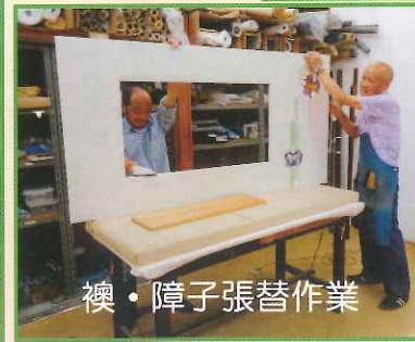
襖・障子張替作業