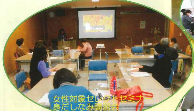
女性対象せいの本セミナー 身だしなみ講習会