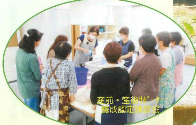
産前・産後婦人科 養成認定講習会