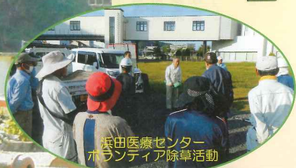
浜田医療センター ボランティア除草活動