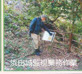
浜田城監視業務作業