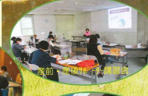
産前・産後婦人科講習会