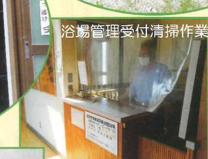
浴場管理受付清掃作業