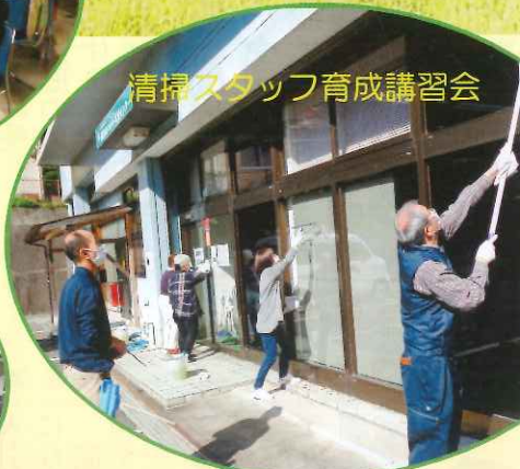
清掃スタッフ育成講習会