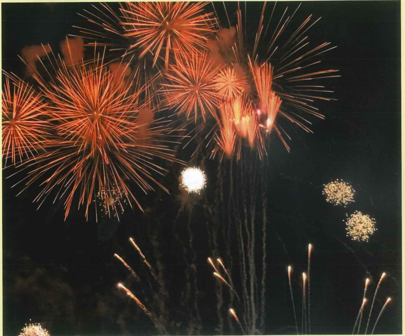
2022石州浜っ子夏まつりの打ち上げ花火